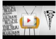
DUDEN-VIDEO Diese Wörter schrieben Geschichte